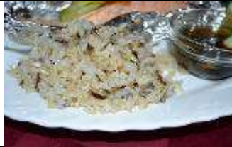
Рис с овощами